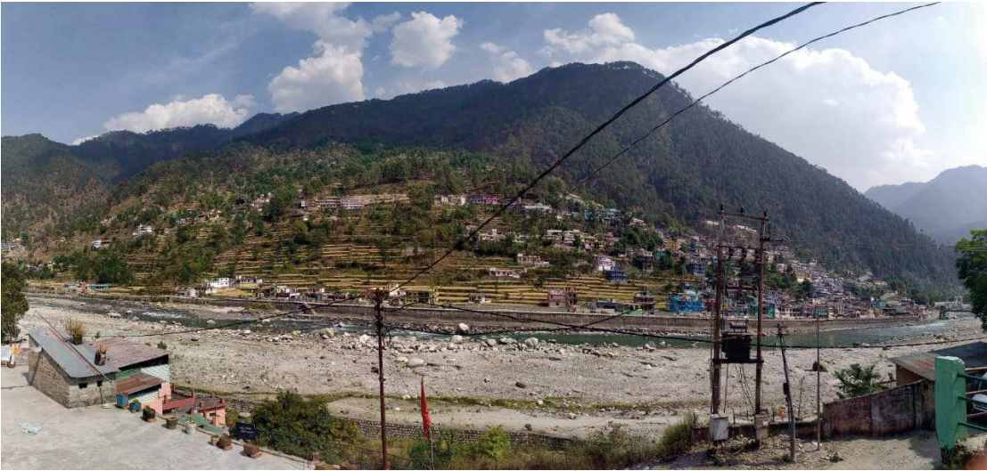
ಉತ್ತರಕಾಶಿಯ ರಮಣೀಯ ದೃಶ್ಯ