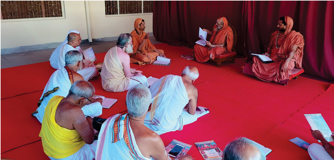
ಪೂಜ್ಯ ಶ್ರೀ ಸ್ವಾಮಿ ಹರಿಬ್ರಹ್ಮೇಂದ್ರಾನಂದತೀರ್ಥರು ಹಾಗೂ ಕಾರ್ಯಕರ್ತರೊಂದಿಗೆ ಹರಿದ್ವಾರದಲ್ಲಿ ಹಮ್ಮಿಕೊಳ್ಳಬೇಕಾದ ಕಾರ್ಯಕ್ರಮಗಳ ಬಗ್ಗೆ ಸಮಾಲೋಚನೆ