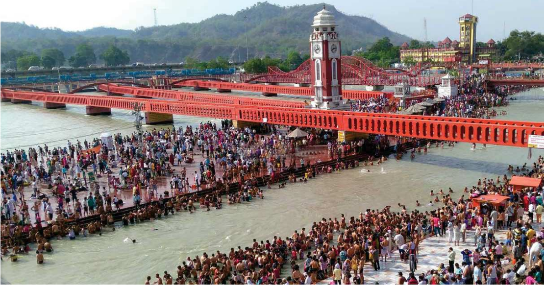
ಹರಿದ್ವಾರದಲ್ಲಿ ಪವಿತ್ರ ಶಾಹಿಸ್ನಾನ ನಡೆಯುವ ಸ್ಥಳ-ಹರ ಕೀ ಪೌಡಿ