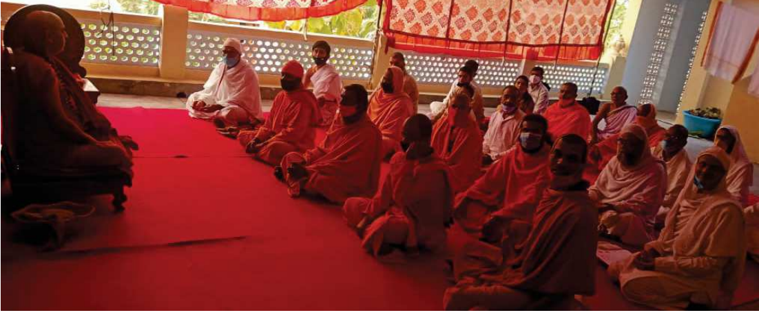
ಸುರತಗಿರಿ ಆಶ್ರಮದಲ್ಲಿ ಸಾಧುಸಂತರೊಂದಿಗೆ ವಿಚಾರವಿನಿಮಯ