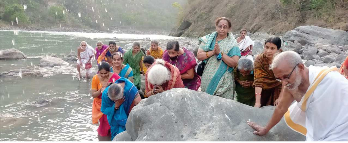
ವಸಿಷ್ಠಗುಹೆಯ ಸಮೀಪ ಗಂಗಾತೀರದಲ್ಲಿ ಕಾರ್ಯಕರ್ತರಿಗೆ ತೀರ್ಥಸಿಂಚನ