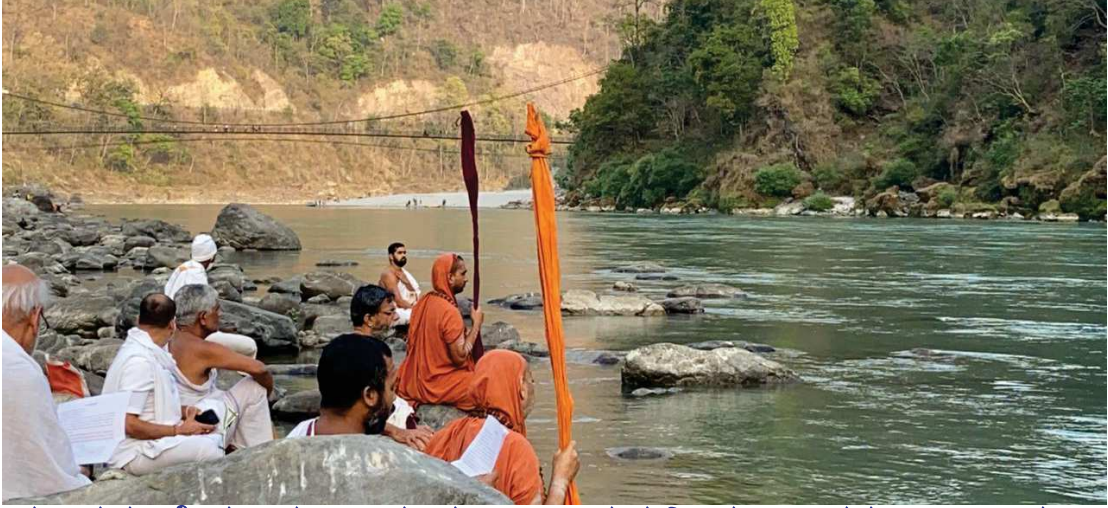
ವಸಿಷ್ಠಗುಹೆಯ ಸಮೀಪ ಗಂಗಾತೀರದಲ್ಲಿ ಗಂಗಾಷ್ಟಕ ಪಾರಾಯಣ