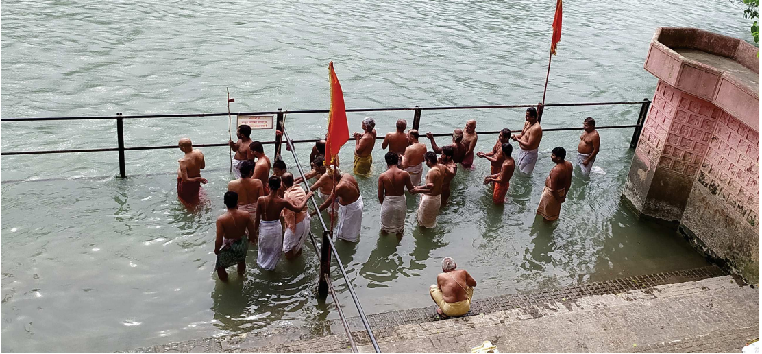
ಹರಿದ್ವಾರದಲ್ಲಿ ಪರಮಪೂಜ್ಯ ಶ್ರೀಶ್ರೀಗಳವರೊಂದಿಗೆ ಪವಿತ್ರ ಗಂಗಾಸ್ನಾನ