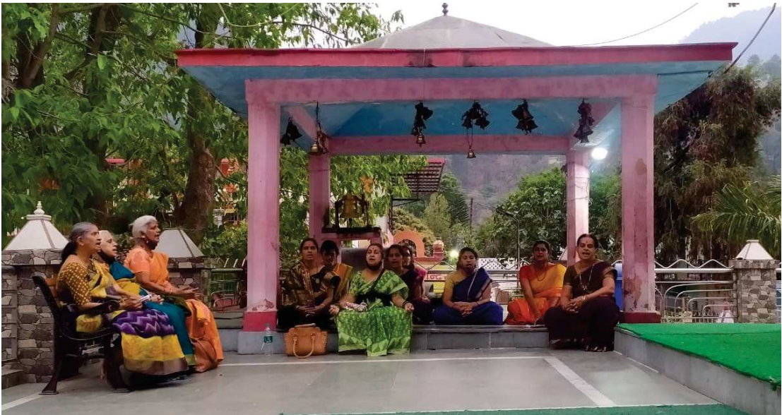
ಉತ್ತರಕಾಶಿಯ ಕಾಶಿವಿಶ್ವನಾಥ ದೇವಾಲಯದಲ್ಲಿ ಸ್ತೋತ್ರಪಾರಾಯಣ