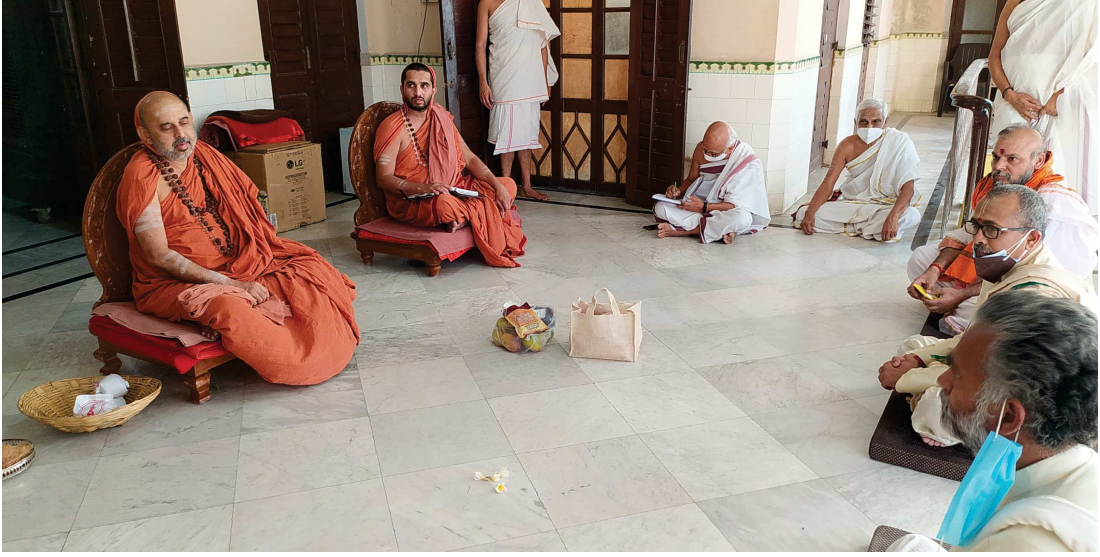
ವಾರಾಣಸಿಯಲ್ಲಿ ಸಂತಸಮಾವೇಶ ಹಾಗೂ ಸೌಂದರ್ಯಲಹರಿ ಅಭಿಯಾನವನ್ನು ಆಯೋಜಿಸುವ ಕುರಿತು ಕಾರ್ಯಕರ್ತರೊಂದಿಗೆ ಸಮಾಲೋಚನೆ