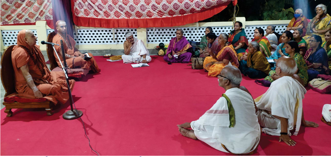
ಹರಿದ್ವಾರಕ್ಕೆ ಆಗಮಿಸಿದ ಮಾತೆಯರು ಹಾಗೂ ಕಾರ್ಯಕರ್ತರ ಗೋಷ್ಠಿ