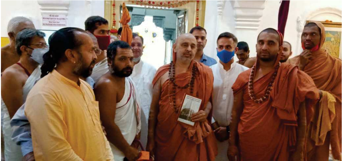
ಹೃಷೀಕೇಶದ ಭರತದೇವಾಲಯದಲ್ಲಿ ಪೂಜ್ಯ ಶ್ರೀಶ್ರೀಗಳವರು