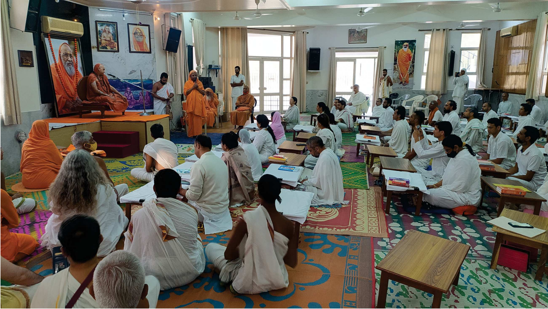
ಆರ್ಷವಿದ್ಯಾಪೀಠದಲ್ಲಿ ಪರಮಪೂಜ್ಯ ಶ್ರೀಶ್ರೀಗಳವರಿಂದ ಅನುಗ್ರಹವಚನ