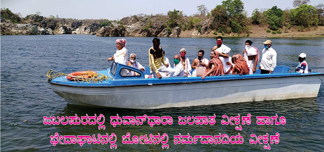
ಜಬಲಪುರದಲ್ಲಿ ಧುವಾನ್‌ಧಾರಾ ಜಲಪಾತ ವೀಕ್ಷಣೆ ಹಾಗೂ ಭೇದಾಘಾಟಿನಲ್ಲಿ ಬೋಟಿನಲ್ಲಿ ನರ್ಮದಾನದಿಯ ವೀಕ್ಷಣೆ