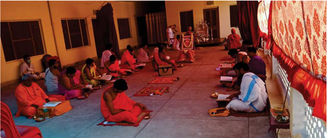
ರಾಮೋತ್ಸವದ ಸಂದರ್ಭದಲ್ಲಿ ವೇದ ಹಾಗೂ ಭಾಷ್ಯಪಾರಾಯಣಗಳು